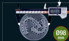
2 bite splints