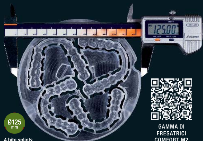
4 bite splints