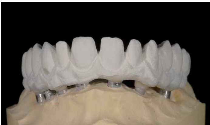
Fig. 9: Preparazione dei denti anteriori per il rivestimento

Dopo averlo nuovamente montato sul modello e aver eliminato la cera, viene ora realizzato su di esso il secondo duplicato con materiale FRAME per la fresatura del Prettau Bridge vero e proprio. Aldo prepara i denti anteriori per il successivo rivestimento con la ICE Zirkon Ceramica circolarmente e per mantenere l'orientamento del canino in zirconio i canini soltanto dalla parte labiale. I denti laterali rimangono in zirconio integrale.