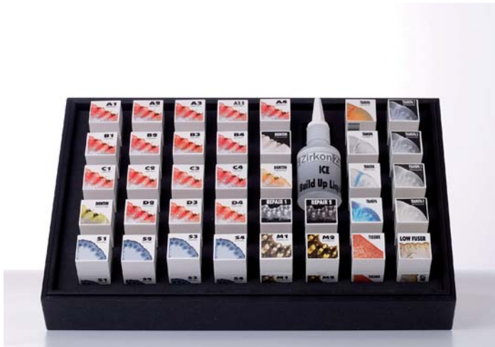
Fig. 13: ICE Zirkon Ceramica

La colorazione dello zirconio è un processo chimico, perciò la „coloratura“ deve essere eseguita con cautela e sensibilità, perché il risultato è riconoscibile soltanto dopo il processo di sinterizzazione. Le gradazioni naturali di colore nella zona dei denti si ottengono utilizzando diversi Color Liquid della ZIRKONZAHN, con un'appropriate diluizione e frequenza della verniciatura. Questa operazione richiede la massima concentrazione!