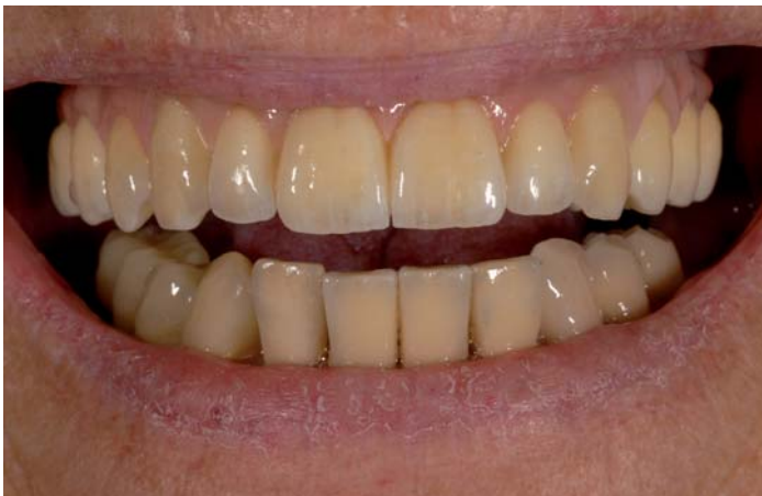
Fig. 23: Sorriso convincente