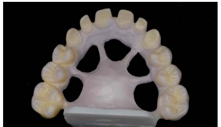
Fig. 11: Struttura colorata e sinterizzata

L'incollatura e la fresatura nello Zirkograph si eseguono secondo un sistema di provata efficacia. Dopo la lavorazione e la levigatura del ponte fresato allo stato grezzo, si esegue la colorazione, ossia la parte artistica del lavoro.