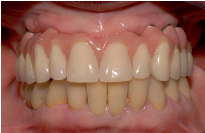
Fig. 1: Situazione di partenza della protesi in resina

Il PRETTAU Bridge è un ponte in zirconio integrale per la ricostruzione implantare - garantito senza chipping (scheggiatura).