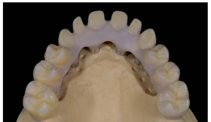
Fig. 12: ... dal forno sul modello