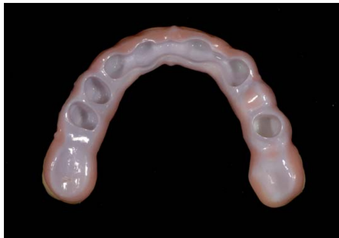
Fig. 19: Ponte dal lato basale

e delle superfici palatali con colori ICE si esegue una cottura di fissaggio. La cottura di glasatura finale sul colore fissato completa il PRETTAU Bridge dal punto di vista della ceramica e deve essere soltanto più lucidato con un gommino come d'abitudine.