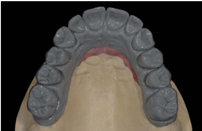
Fig. 4: Modellazione in cera

Le basi di lavoro del Prettau Bridge sono un modello con maschera gengivale ed una modellazione in cera, con cui si può elaborare in modo tradizionale l'occlusione, la disposizione e la forma dei denti. Il modello e la struttura in cera vengono interamente duplicati.