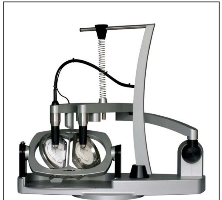
Fig. 2: Designer Zirkograph

„Mamma Luca“ ha 7 innesti dentali nella mascella superiore, nel gruppo 15-25; secondo Aldo Zilio una ragione sufficiente per realizzare un Prettau Bridge da 16 a 26. Le protesi nella zona degli elementi 13-23 sono state collegate con degli attacchi a barra e sugli elementi 15, 24 e 25 sono state applicate delle corone coniche singole.