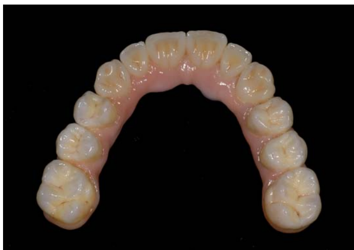
Fig. 18: PRETTAU Bridge colorato e glasato

Il PRETTAU Bridge può essere riscaldato ad un massimo di 35 gradi/ tasso di salita minimo e il tempo di mantenimento con la temperatura finale non deve in nessun caso essere inferiore a 2 minuti, perché altrimenti la cottura della ceramica risulta difettosa.