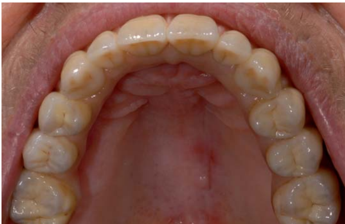
Fig. 22: Vista oclusale