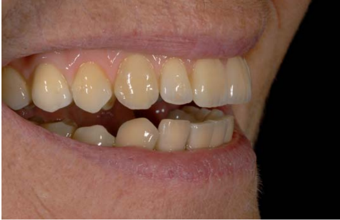
Fig. 21: Vista laterale

Per quanto riguarda la forma fisiologica strutturale e basale, il Prettau Bridge di Aldo potrebbe perfino essere cementato definitivamente, ma la cementazione provvisoria è da preferire per un possibile successivo allentamento del ponte.