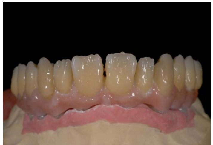
Fig. 16: Prima cottura della dentina per denti anteriori e gengiva

È ogni volta un grande avvenimento, la mattina seguente, dopo la sinterizzazione, prelevare dal forno un PRETTAU Bridge e con poche correzioni di precisione appoggiarlo sul modello e sulla sottostruttura - e se poi la prova sul paziente va altrettanto bene, allora ci si sente già un poco come degli eroi, ma ancora non è arrivata l'ora di fermarsi, l'opera deve essere portata a termine. È un vero piacere rivestire i denti anteriori e dare alla gengiva il suo aspetto fisiologico applicando uno strato in ceramica sulle „parti arteriose“, perché i ponti in zirconio sono e rimangono assolutamente stabili alla cottura. Chi non ricorda i ponti in metallo da 14 elementi ed i „timori della cottura“ ad essi legati?