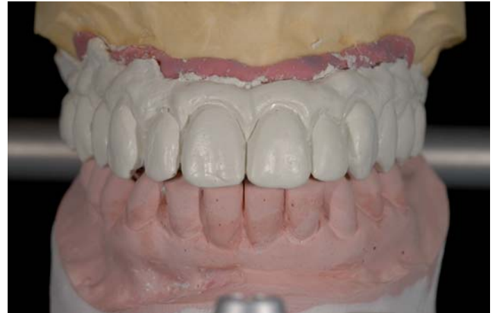
Fig. 5: Ponte duplicato con materiale FRAME

Dalla forma negativa e dal modello riposizionato si ottiene il 1° duplicato del ponte in cera con ZIRKONZAHN FRAME, una resina speciale resistente al restringimento. Già nel primo stadio si esegue la prova sul paziente controllando e confermando il ponte per quanto riguarda la posizione, la forma e la funzionalità.