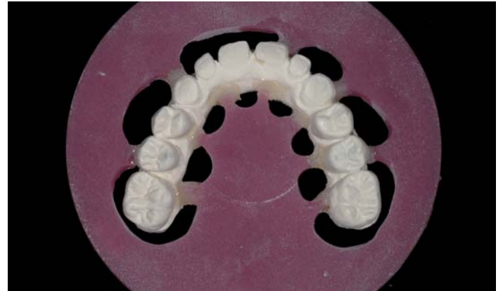
Fig. 10: Per fresare i ponti incollati

L'incollatura e la fresatura nello Zirkograph si eseguono secondo un sistema di provata efficacia. Dopo la lavorazione e la levigatura del ponte fresato allo stato grezzo, si esegue la colorazione, ossia la parte artistica del lavoro.