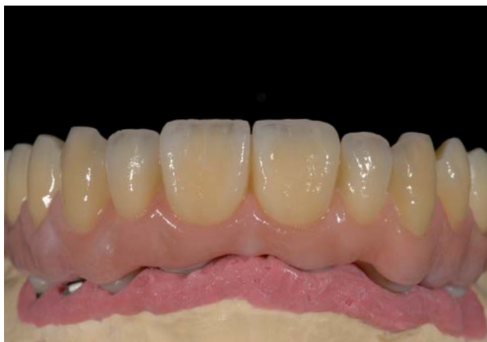
Fig. 17: Seconda cottura della dentina

L'ossido di zirconio è uno scarsissimo conduttore di calore, perciò quando si cuociono dei ponti grandi e nel nostro caso dei ponti particolarmente grandi, si deve fare molta attenzione al ciclo di cottura. La maggior parte delle indicazioni del costruttore riguardo al tasso di salita e al tempo di mantenimento delle loro ceramiche in zirconio è tutt'al più applicabile per le singole corone. Già un ponte a 3 elementi con un elemento intermedio massiccio può essere cotto in modo errato se si seguono ciecamente le tabelle di cottura.