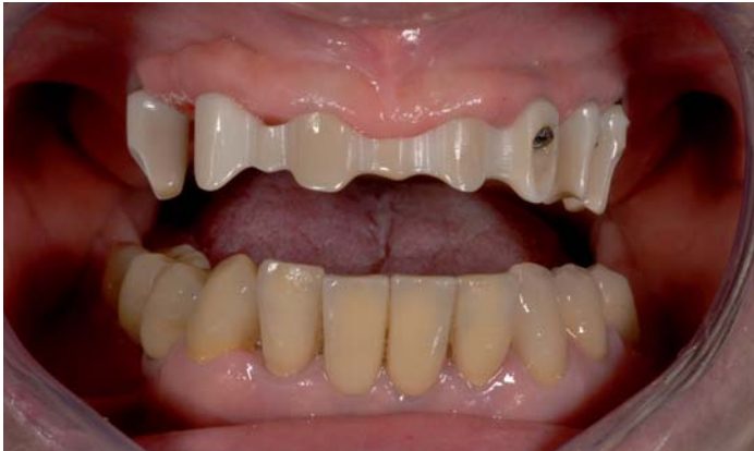
Fig. 7: Prova dell'attacco a barra/prova principale sul paziente