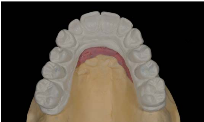
Fig. 8: Secondo duplicato per la fresatura del ponte

Dopo averlo nuovamente montato sul modello e aver eliminato la cera, viene ora realizzato su di esso il secondo duplicato con materiale FRAME per la fresatura del Prettau Bridge vero e proprio. Aldo prepara i denti anteriori per il successivo rivestimento con la ICE Zirkon Ceramica circolarmente e per mantenere l'orientamento del canino in zirconio i canini soltanto dalla parte labiale. I denti laterali rimangono in zirconio integrale.