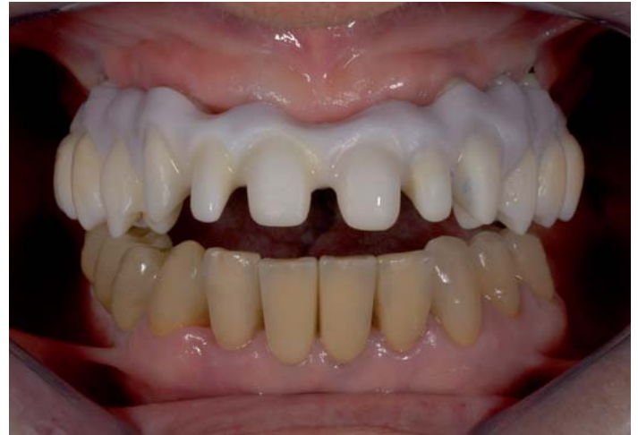
Fig. 15: ... anche in situ

Dal punto di vista chimico, finora non si è ancora riusciti a produrre un Color Liquid nettamente rosa per le parti gengivali, ma con la tonalità esistente, color gengiva tendente al lilla, almeno le „parti venose“ sono rappresentate nel modo migliore.