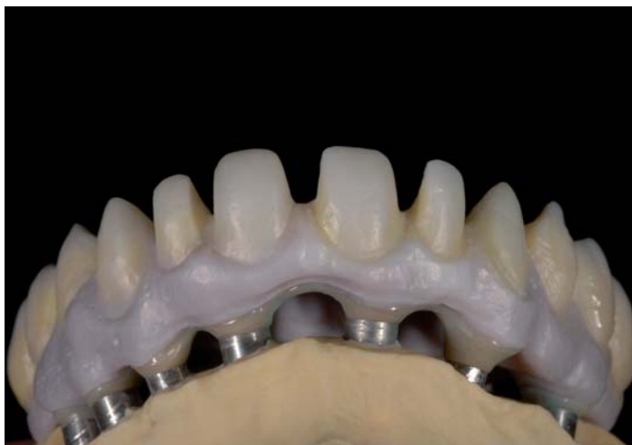
Fig. 14: Adattamento splendido

Dal punto di vista chimico, finora non si è ancora riusciti a produrre un Color Liquid nettamente rosa per le parti gengivali, ma con la tonalità esistente, color gengiva tendente al lilla, almeno le „parti venose“ sono rappresentate nel modo migliore.