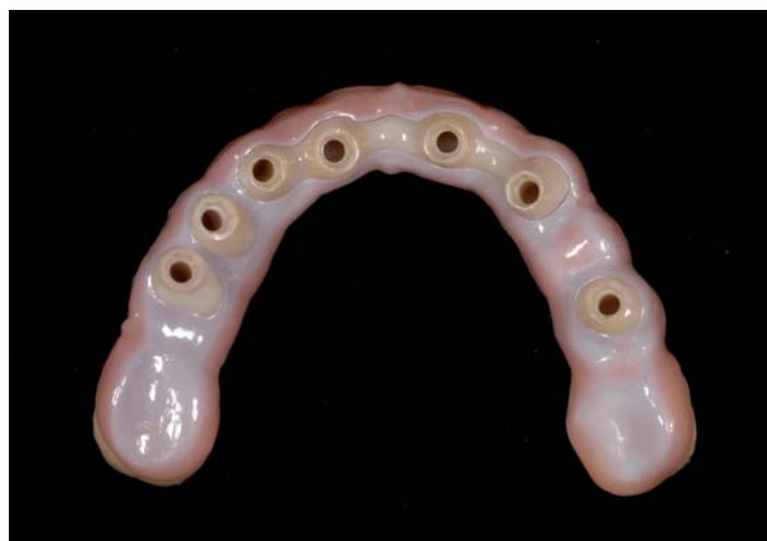
Fig. 20: Transizioni perfette tra le parti primarie e le parti secondarie

Con il TRANSPA ZIRKON sviluppato di recente dalla ZIRKONZAHN e con adeguate capacità artigianali si ottiene un aspetto naturale senza compromessi ottici tra denti rivestiti e denti in zirconio.