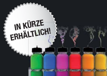
Colour Liquid Aquarell Bio-Pigment