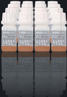
Colour Liquid Prettau® Aquarell A1-D4

auf Wasserbasis mit Bio-Pigmenten, zum säurefreien Einfärben von Prettau® Grünzirkon mit Pinseltechnik