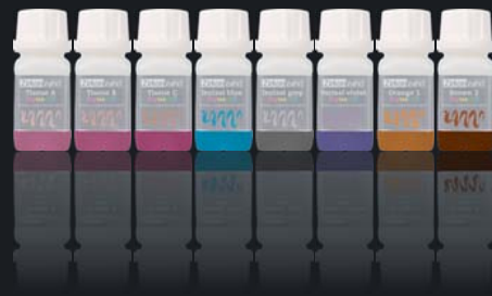
Colour Liquid Prettau® Aquarell Intensiv

20 ml erhältlich , geeignet für Prettau® Zirkon