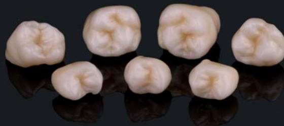
nach dem Sintern