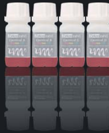
Colour Liquid Prettau® Aquarell Cervical A-D

20 ml oder 50 ml im Set oder einzeln erhältlich