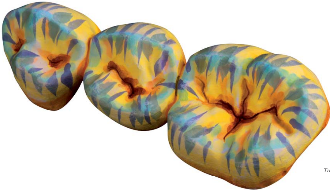
Trabajo coloreado antes de la sinterización

La gama de colores Color Liquid Prettau® Aquarell corresponde básicamente a los 16 colores que abarcan el amplio espectro cromático de la guía de colores Vita. Son producidos a base de agua, y no contienen ácido. Para ayuda visual, estos nuevos líquidos contienen bio-pigmentos especiales calcinables, los cuales sirven como marcador y ayudan a orientarse al momento de trabajar para la distribución de los grados del color. Coloraciones individuales o detalles como los mamelones, las áreas interproximales y cervicales, son considerablemente