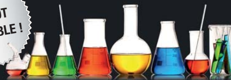
Colour Liquid Aquarell Bio-Pigment

En flacons de 10 ml, disponibles seuls ou en kit complet