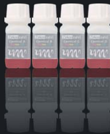
Colour Liquid Prettau® Aquarell Cervical A-D

En flacons de 20 ml ou 50 ml, disponibles seuls ou en kit complet