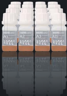
Colour Liquid Prettau® Aquarell A1-D4

À base d'eau avec des pigments bio, pour la coloration sans acides de la zircone Prettau® pré-frittée au pinceau