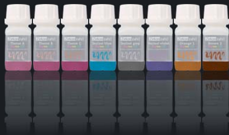
Colour Liquid Prettau® Aquarell Intensiv

En flacons de 20 ml, à utiliser avec la Zircone Prettau®