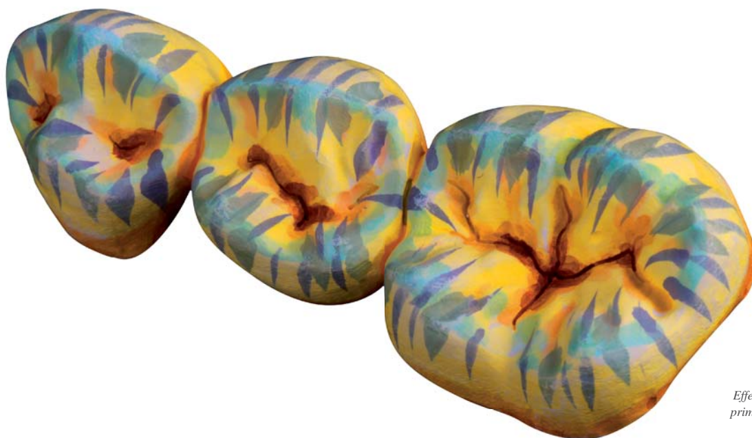
Effetto del lavoro colorato prima della sinterizzazione

I 16 colori della serie Colour Liquid Prettau® Aquarell coprono l'intero spettro cromatico della "scala vita", sono a base di acqua e privi di acidi. Questi nuovi colori sono inoltre dotati di speciali pigmenti bio calcinabili che permettono un facile orientamento nella scelta della tonalità più adatta, e rendono visibile ogni singola pennellata che può essere controllata prima del processo di sinterizzazione. La colorazione personalizzata dei particolari, p.es. dei mamelloni, delle aree cervicali e interdentali, può così essere notevolmente accentuata ed eseguita con estrema precisione.