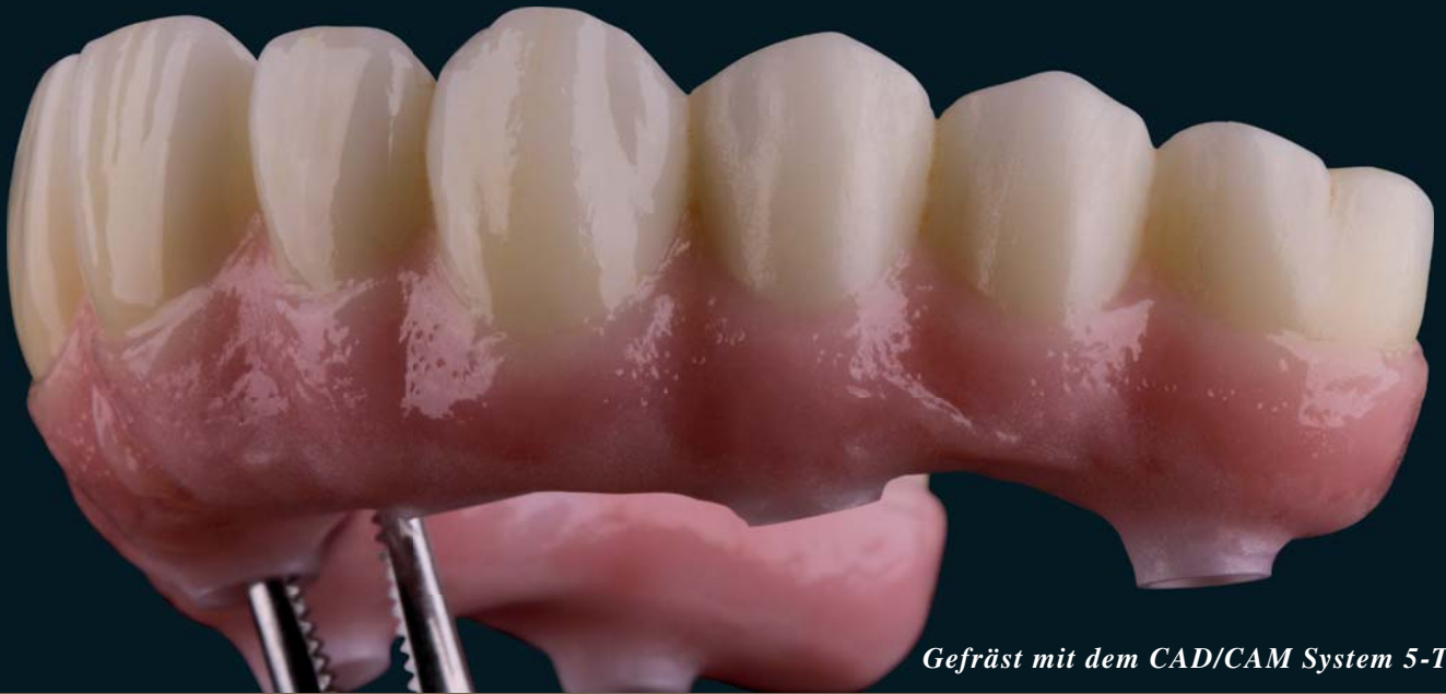
Gefräst mit dem CAD/CAM System 5-TEC