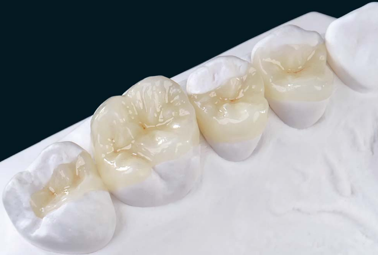
Inlays und Onlays aus Prettau® Anterior® bemalt mit ICE Zirkon Malfarben 3D by Enrico Steger