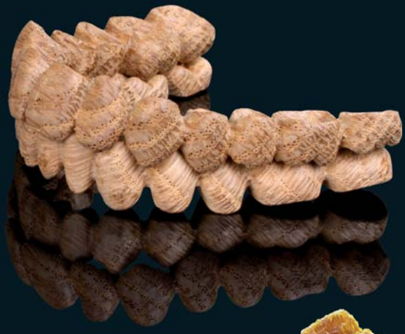
madera de roble encerada