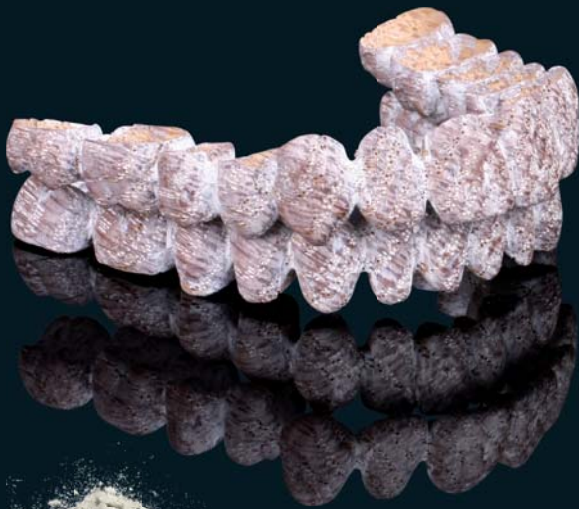
madera de roble encalada

En respecto estético, los puentes pueden ser encalados o sumergidos en cera de abejas. Si se desea, se puede procesar además en roble ahumado.