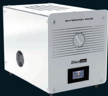
Sinterofen 300S, four pour métal pré-fritté

Zirkonofen 700 Ultra-Vakuum avec Sinter Metal Furnace Adapter, four pour zircone et métal pré-fritté