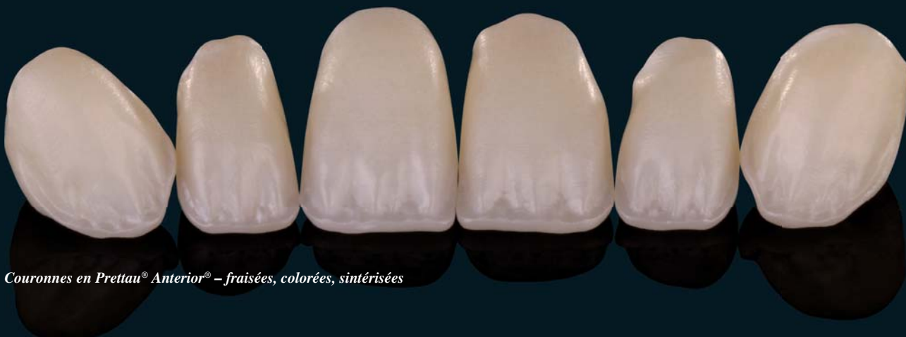
Couronnes en Prettau® Anterior® – fraîsées, colorées, sintérisées