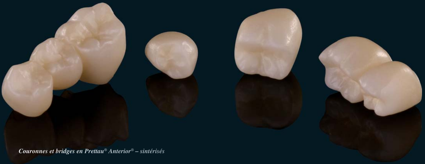
Couronnes et bridges en Prettau® Anterior® – sinterisés