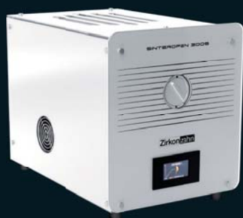
Sinterofen 300S: forno per metallo pre-sinterizzato

Zirkonofen 700 Ultra-Vakuum con Sinter Metal Furnace Adapter: forno per zirconia e per metallo pre-sinterizzato