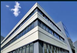
Zirkonzahn World Wide