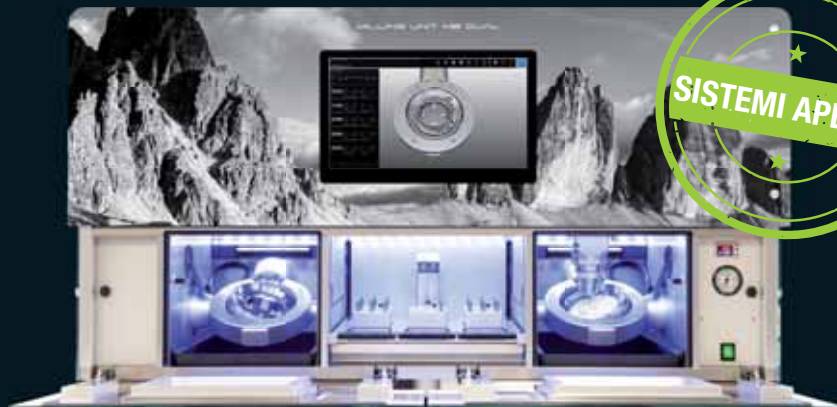
FRESATURA A UMIDO

PER LA LAVORAZIONE IN SERIE A UMIDO E A SECCO SENZA PULIZIA INTERMEDIA