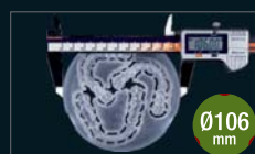
3 bite splints