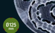
4 bite splints