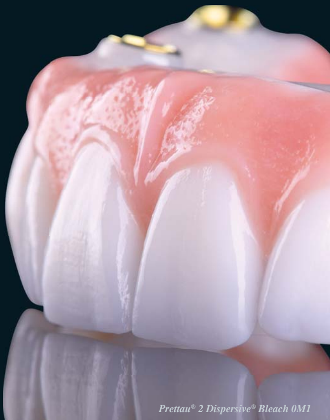
Prettau® 2 Dispersive® Bleach 0M1