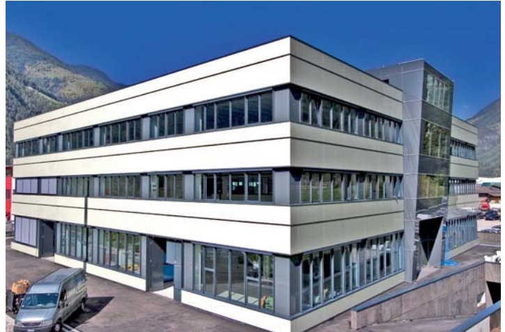
La sede principale della Zirkonzahn a Gais, Alto Adige

adatta alla stratificazione con ceramica, la Zirconia Prettau® si adatta invece ai restauri estesi ad elevata stabilità, mentre la zirconia Prettau® Anterior® è indicata per i restauri ad alto valore estetico. I restauri in Zirconia Prettau® non richiedono la stratificazione con ceramica, evitando così la formazione di scheggiature.