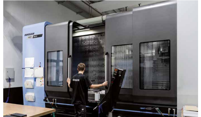
Arbeiten am hochmodernem CNC-Bearbeitungszentrum zur Metallbearbeitung.

Auch die Möglichkeiten zur Weiterbildung sind schier grenzenlos! Ich besuchte bereits Kurse für Messtechnik, CAM-Programmierung sowie diverse fertigungstechnische Lehrgänge und bin immer bestrebt, mich weiterzuentwickeln und mein Können zu perfektionieren.