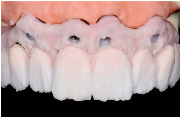
Foto 14. antes de la primera cocción

Las zonas interproximales con T3 (masa inciso blanquecina de la cerámica ICE) y una formación de láminas de diferentes masas de inciso y masas transparentes de nuestra surtida gama, complementan la forma del diente.