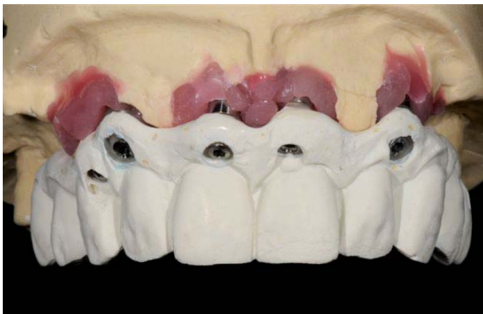
Foto 2: estructura de Frame después del duplicado de la estructura con dientes protésicos

Un marcado prognatismo y un periodoncio en estado débil no nos dejan otra elección. La solución es extraer y, finalmente, tratar con implantes. Teniendo en cuenta las fantásticas posibilidades que ofrece Zirkonzahn, fue posible elaborar un tratamiento que convenciese tanto por la estética como por su función.