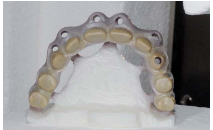
Foto 7: estructura recién sacada del horno después de la sinterización

Para que estos puentes tan grandes no se deformen durante la sinterización, no deben retirarse ni la base ni las uniones, las cuales deberán colocarse verticalmente en el horno.