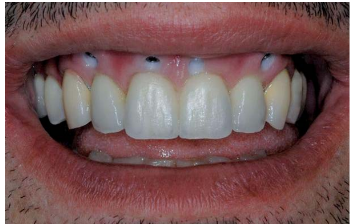
Foto 16: antes del acabado ya se puede ver el buen resultado estético

Gracias al meticuloso trabajo de preparación, podemos acabar el trabajo sin hacer más correcciones.